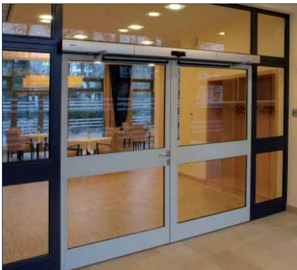
GEZE Slimdrive EMD F-IS · Johanniter Pflegeheim, Berlin