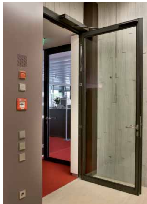
GEZE Slimdrive EMD · Kreissparkasse Ludwigsburg